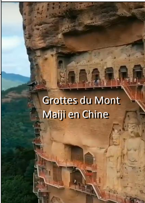
Grottes du Mont Majji en Chine

Si une région se déclarait comme une banque, comme l'ont fait la Poste ou des grandes surfaces, avec des fonds issus de ses électeurs qui sont investis pour ses projets, elle pourrait alors emprunter à la banque centrale au même titre qu'une banque ordinaire. Exit les taux prohibitifs des banques privés auxquels elle doit se financer actuellement.