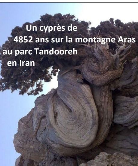
Un cyprès de 4852 ans sur la montagne Aras au parc Tandooreh en Iran

Pertes 50,3 milliards ! Tout français quelque soit son âge a perdu 743 €. L'état a déjà programmé -164,9 Md€ de perte pour l'année ! Obligations d'état rapportent 3% ! Il y a peu c'étaient encore à 0% ! L'idée capitaliste d'ôter tout moyen d'action aux états pour permettre aux groupes privés de diriger elles-mêmes les démocraties est en route.